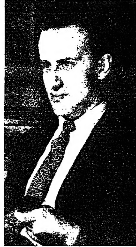
بوريس فيان، مدونه العاصفة العتقة